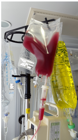
<사진2 조혈모세포 이식하는 날>